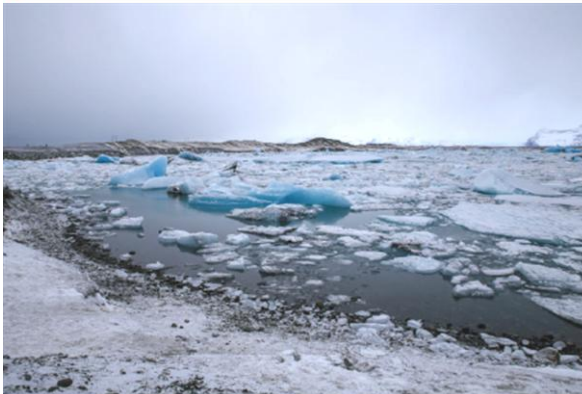
i Laguna lodowcowa Jökulsárlón i błękitne kry