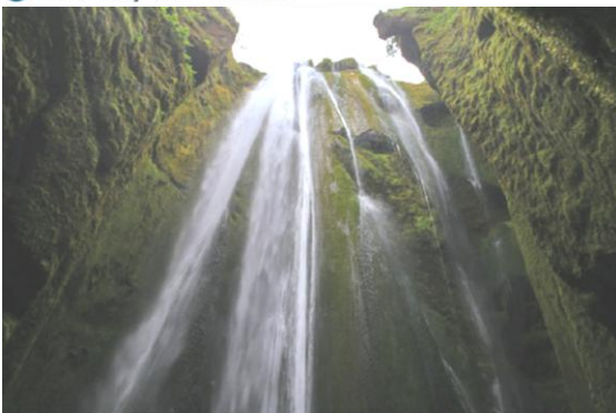
i Wodospad Gljúfrafúsi (Islandia)