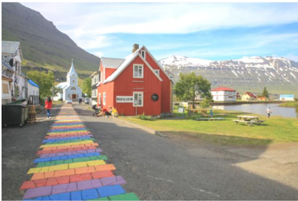
i Miasteczko Seyðisfjörður - w tle Niebieski Kościół