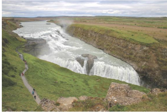
i Wodospad Gullfoss - Islandia