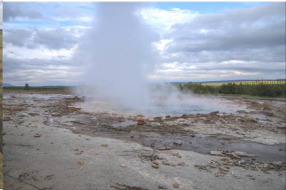
i Gejzer Strokkur (Islandia)