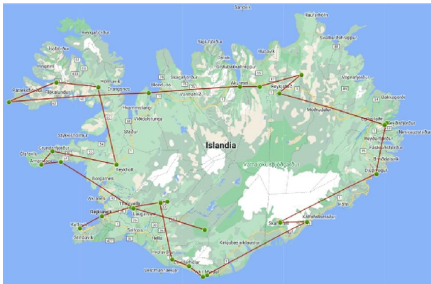
Najbardziej popularne trasy wycieczkowe po Islandii

Na Islandii jest 30 miejsc, które warto zobaczyć. Dla turystów z Polski nie jest wymagane zaproszenie, paszport, czy wiza, Można jechać na dowód osobisty. Wymagane są jednak ubezpieczenia.