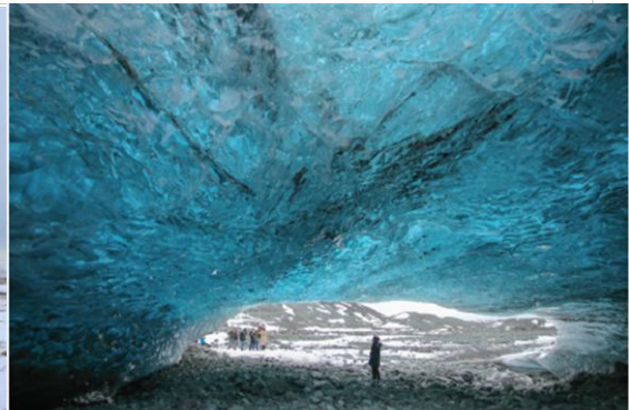
i Niesamowity kolor islandzkiej jaskini lodowcowej przy lagunie Jökulsárlón