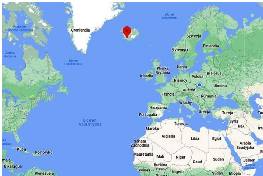
Położenie wyspy Islandia

Islandia to Republika - państwo położone w Europie Północnej, na wyspie o tej samej nazwie, archipelag w północnej części Oceanu Atlantyckiego. Islandia jest jednym z krajów nordyckich, to kraj geograficznych kontrastów. Powierzchnię ponad 103 tys. km 2 (czyli 1/3 powierzchni Polski), zamieszkuje tylko ok. 335 tysięcy mieszkańców.