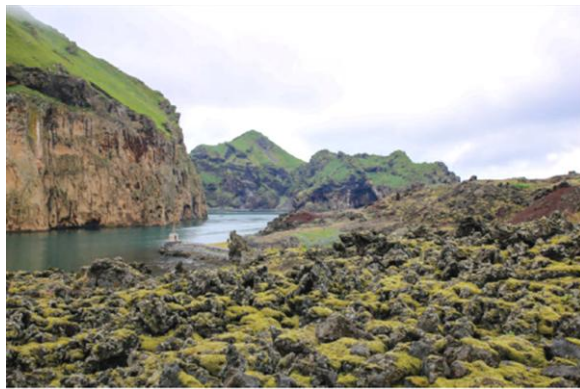
i Powulkaniczny krajobraz wyspy Heimaey