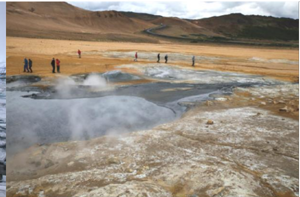
i Obszar geotermalny Hverir