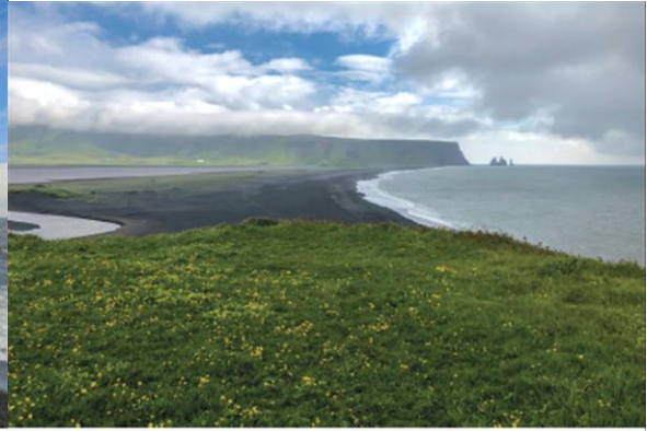
i Widok na Czarną Plażę - Dyrhólaey