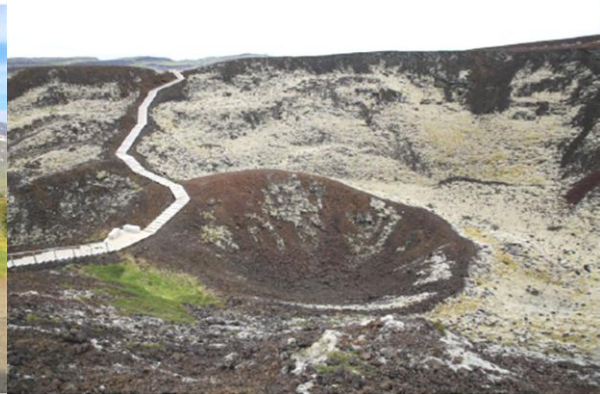
i Krater Grábrók (Islandia)