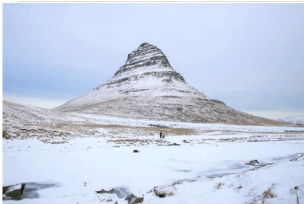
i Góra Kirkjufell - Islandia