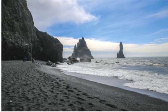
i Czarna plaża Reynisfjara (Islandia)