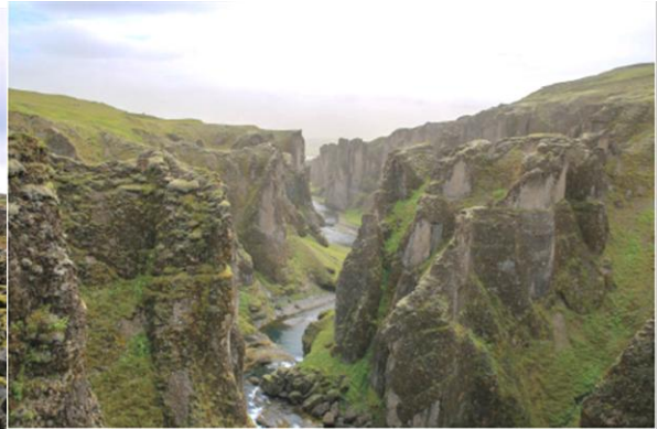
i Kanion Fjaðrárgljúfur (Islandia)