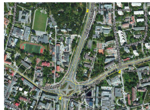
*MIEJSCA WIDOKÓW Z POZIOMU CZŁOWIEKA (OZNACZONE ŻÓŁTYMI PINESKAMI)